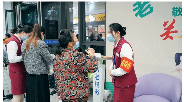
西院区老年驿站画面