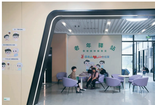
东院区老年驿站画面

老吾老以及人之老,为进一步改善群众就医体验,聚焦老年人就医中的“急难愁盼”问题,为老年人提供更有温度的医疗服务,贯彻落实省卫生健康委《关于做好实施 80 岁以上老人,门诊就医“零等待”惠民实项目准备工作的通知》的要求,通大附院在方便老年人门诊就医方面又增新举措——开展“80 之约 附院相伴”活动。