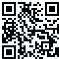
扫码读千篇科普文章